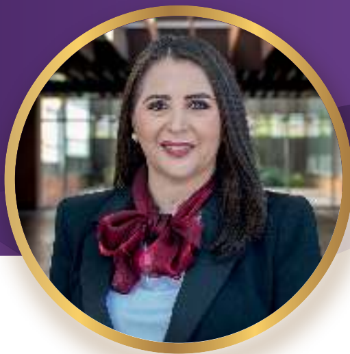
Magistrada Anel Bañuelos Meneses Presidenta del Tribunal Superior de Justicia del Estado de Tlaxcala