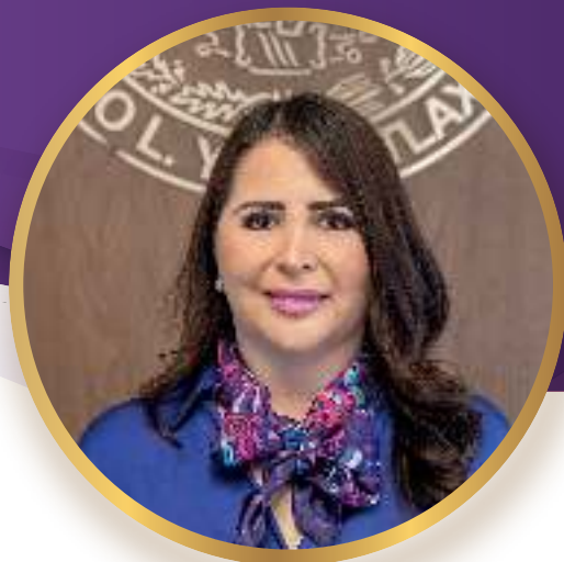
Magistrada Anel Bañuelos Meneses Presidenta del Consejo de la Judicatura del Estado de Tlaxcala