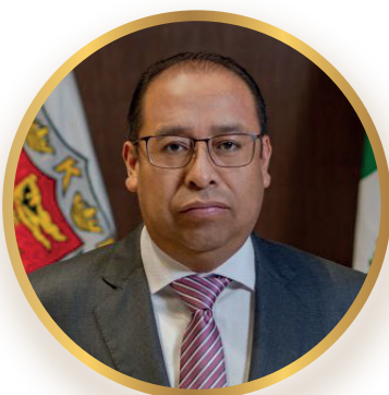
Germán Mendoza Papalotzi Presidente de la Comisión de Vigilancia y Visitaduría